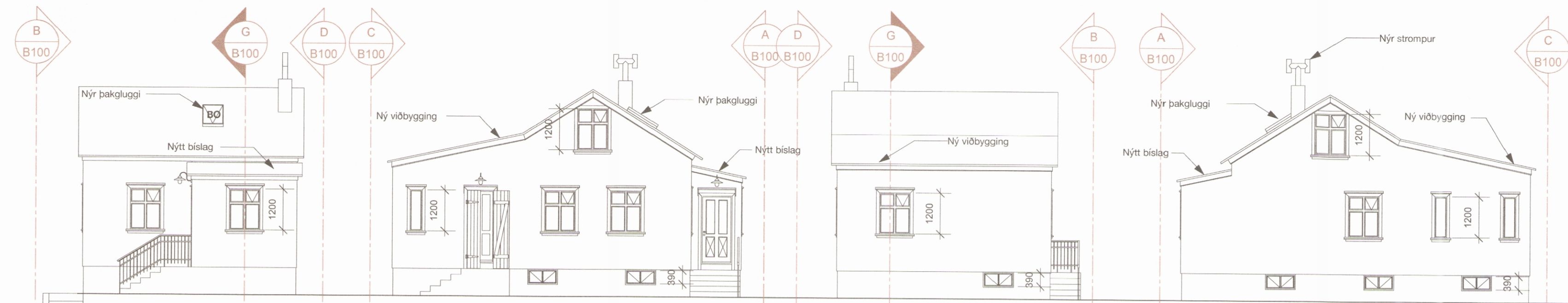
A Ásýnd suður 1:100