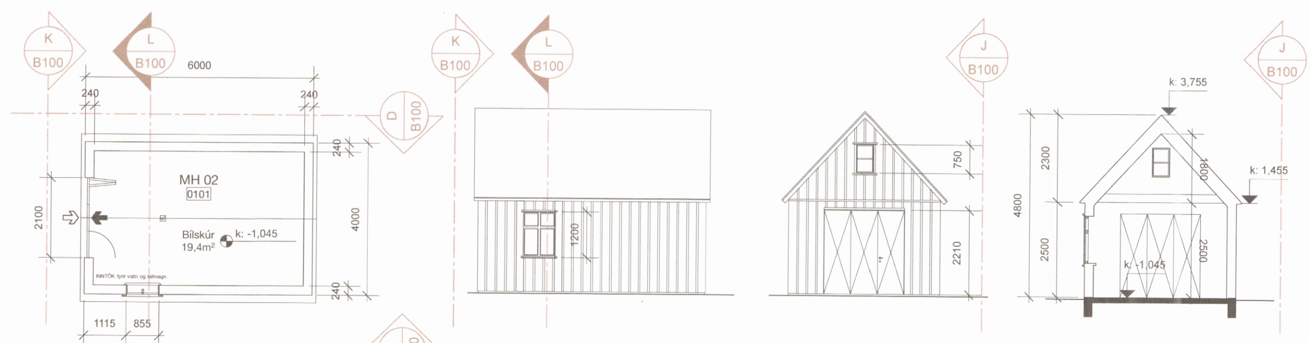
I Bílskúr grunnmynd 1:100

Öll mál í millimetrum Mælið ekki af teikningum Misræmi í teikningum tilkynnast arkitektum strax Lesið skal teikningar með viðeigandi verklýsingum, ásamt viðeigandi teikningum og verklýsingum annarra hönnuða © Studio Granda