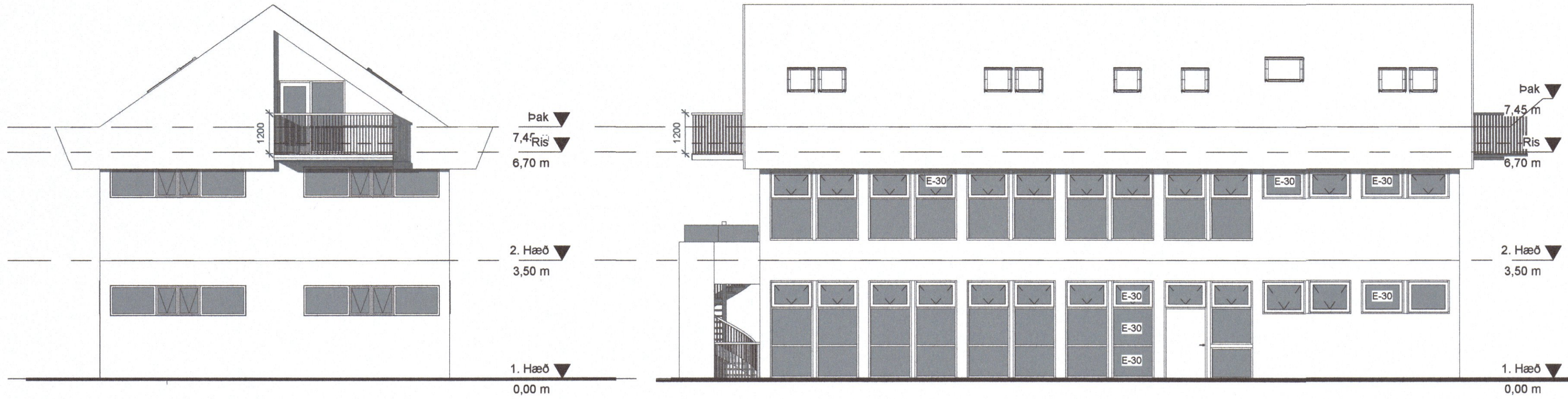
1 Norð vestur 1 : 100